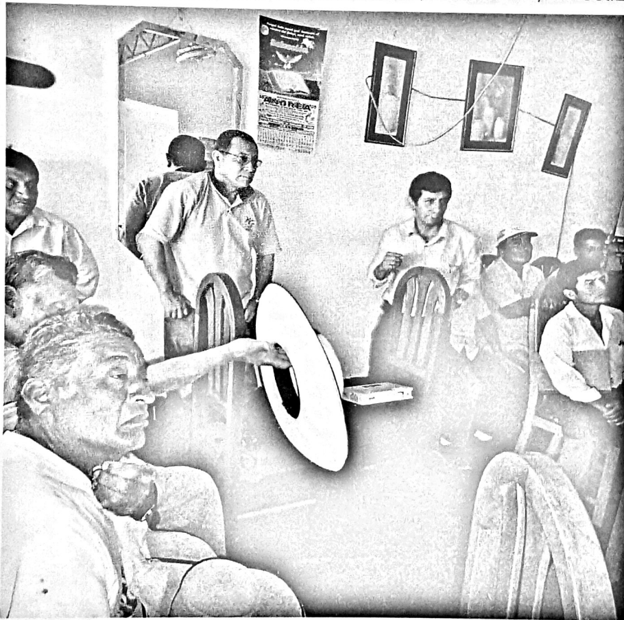
Exposición del proyecto para comuneros de La Montería, en el caserío de Wadintong. 08. Agosto de 2011